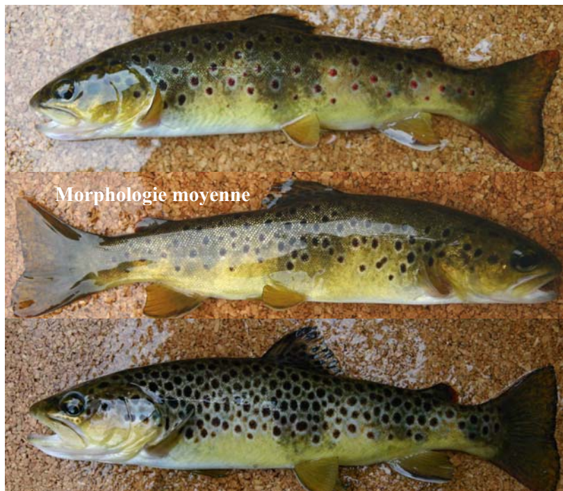
Illustration du morphotype de la population

pr-a : nb. de points rouges sur la zone A pn-a : nb. de points noirs sur la zone A